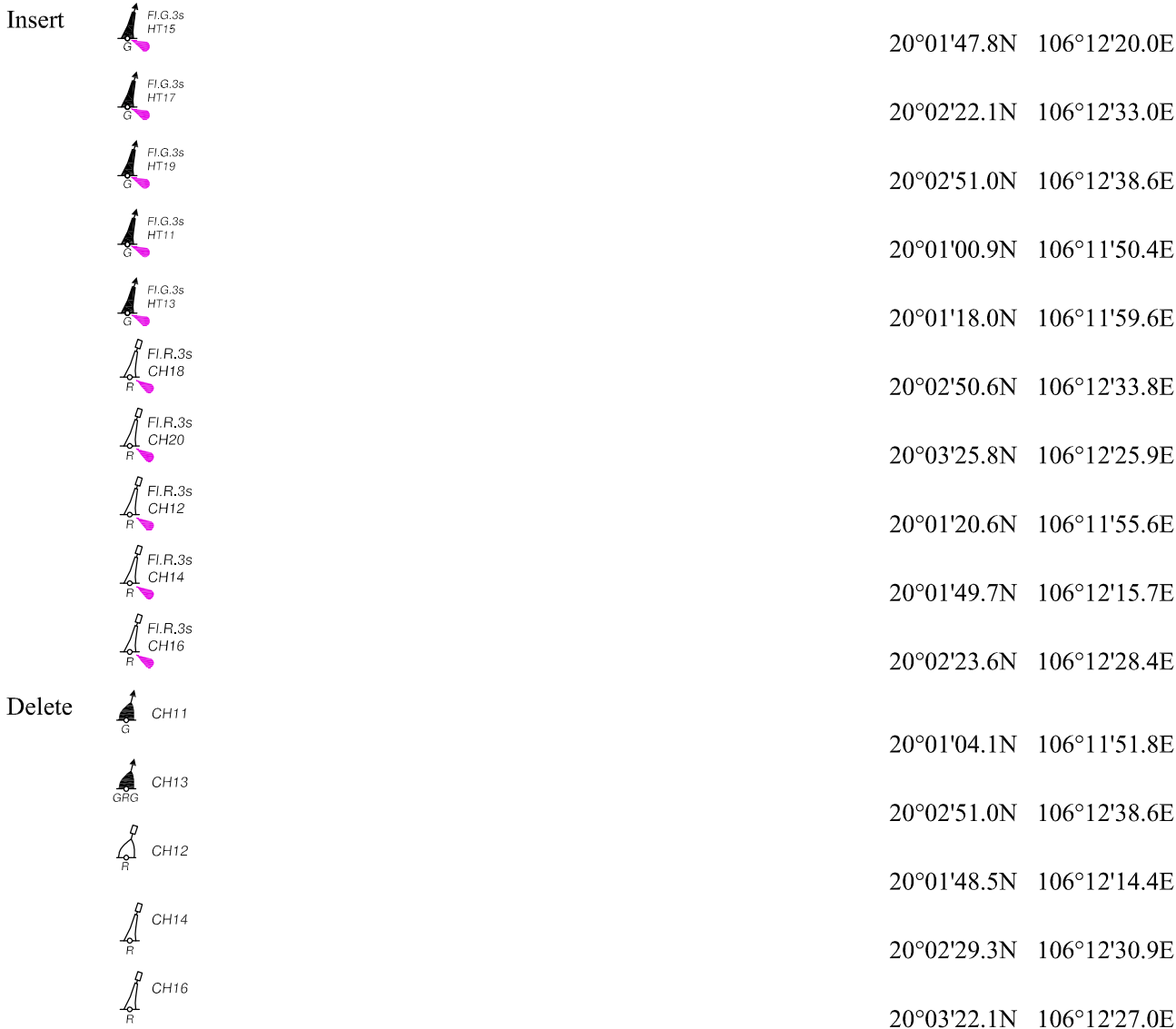
Chart affected - VN50010 (Edition number 2, Edition date June 8 th , 2016)

(All positions are referred to WGS84 Datum)