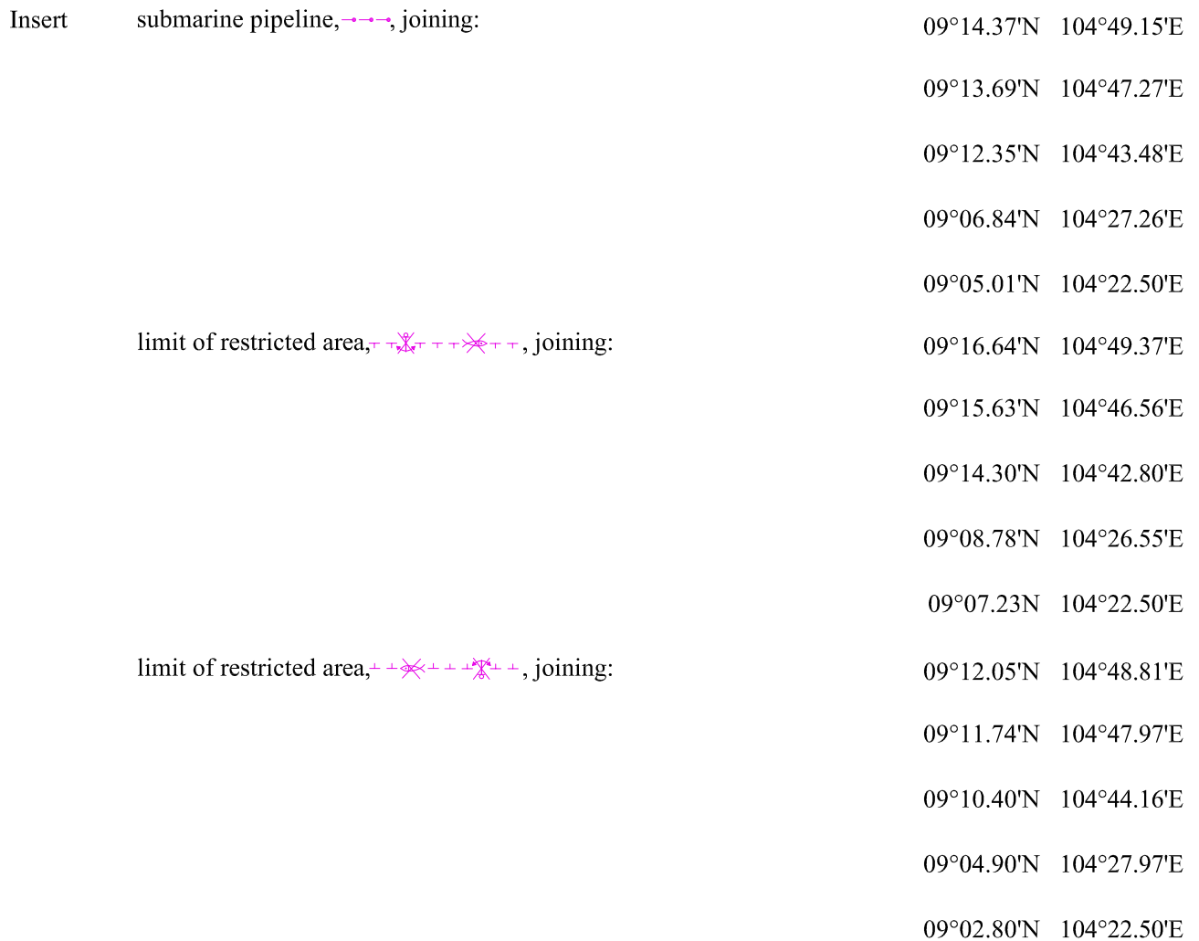
Chart affected - VN30032 (Edition number 1, Edition date Dec 22 nd , 2015)

(All position are referred to WGS84 Datum)