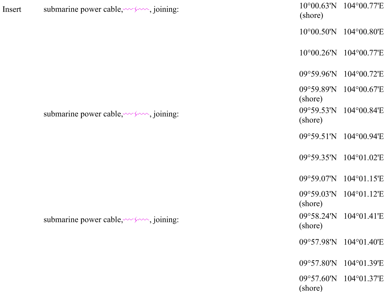
Chart affected - VN30036 (Edition number 1, Edition date June 1 st , 2017)

(All positions are referred to WGS84 Datum)